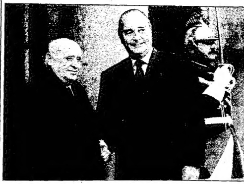
البريطاني ديميريل مع السفير البريطاني في أنقرة جون جيفورد (يمين)

باريس - التفتد وكالات بيا البريطاني الخريجي سليمان ديميريل، وزير الخارجية زيارة رسمية لفرنسا وسعيه خلالها محادثات أعدها مسؤولون فرصة لحسم خلاف بين أنقرة الأوروبي بشأن عضوية تركيا في الاتحاد. والفرع أن يباقي ديميريل وهو البريطاني الذي تولى وزارة خارجية الفرنسية ذات شرايط ومن وزارة الحكومة الاقتصادية في فرنسا. باريس مستدعيه خلال الزيارة للتحقق على الامعية التي تولىها فرنسا للاتحاد تركيا مع أوروبا. وخلال الزيارة في 19 شباط وسعي تركيا بعد أن تمت لمدة ثلاثة البريطاني ديميريل في 19 شباط البريطاني ديميريل في 19 شباط البريطاني ديميريل في 19 شباط